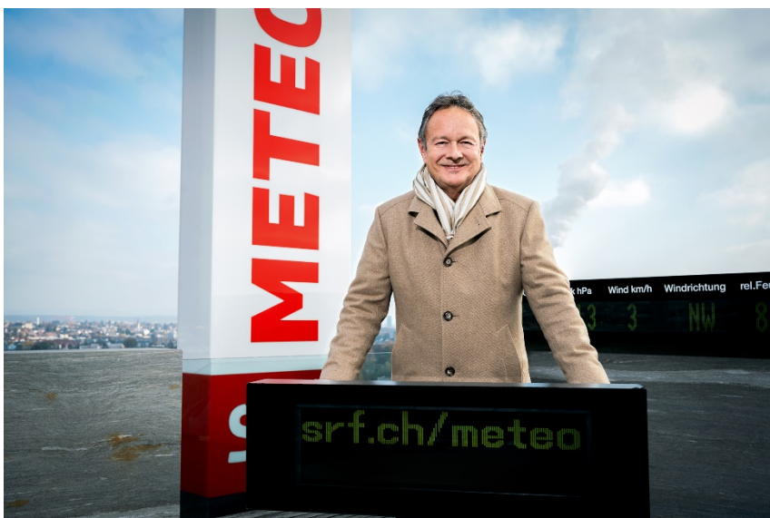
Schweizer Meteorologe und Fernsehmoderator Thomas Bucheli.