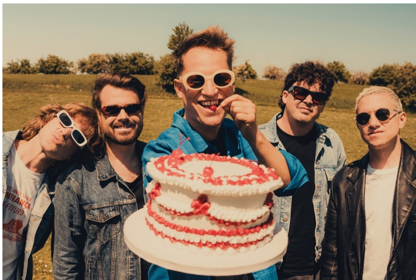
Die Schweizer Mundartband „Hecht“ um Frontmann Stefan Buck.