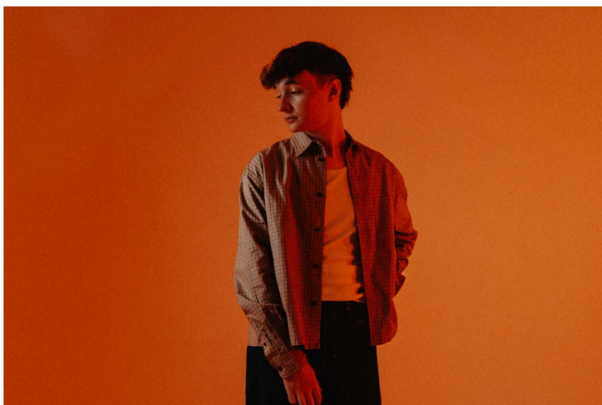
Der ehemalige ESC-Teilnehmer Remo Forrer.