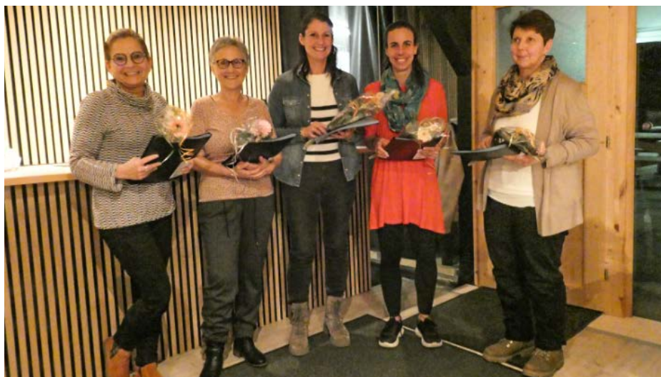
Fünf der sieben Neumitglieder des Chors Solcanta Römerswil.