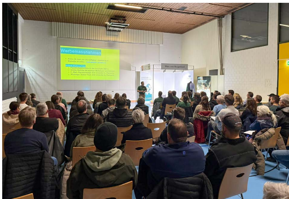
Über 60 Aussteller verfolgten gespannt die zahlreichen Informationen.